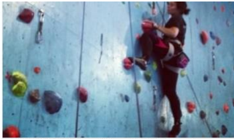
HENGER HØYT: Klatring er blitt en viktig hobby for amerikaneren.

Studentene reiser dit de vil og bor hos tre forskjellige vertsfamilier i løpet av året.